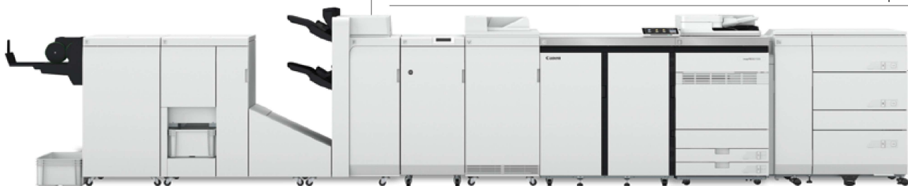
Appareil imagePRESS V1000 illustré avec accessoires optionnels.