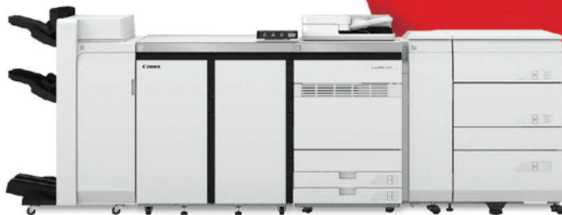
Appareil imagePRESS V1000 illustré avec accessoires optionnels.