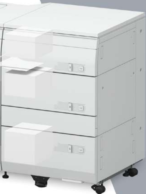
Presse imagePRESS V1000 illustrée avec des accessoires optionnels.